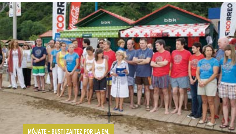
MÓJATE - BUSTI ZAITEZ POR LA EM.