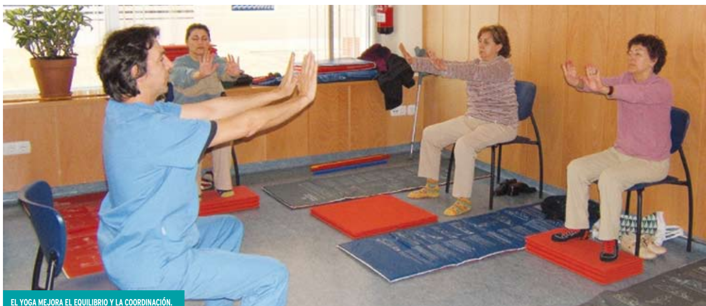
EL YOGA MEJORA EL EQUILIBRIO Y LA COORDINACIÓN.

Además, los afectados se pueden beneficiar ante necesidades puntuales (vacaciones, brote, reparación de silla de ruedas...). Éste es un servicio cada vez más demandado por los socios. En 2010 se han realizado un total de 40 préstamos. Las ayudas técnicas más solicitadas este año han sido las sillas de ruedas manuales, las 'scooter' y los cojines antiescaras.