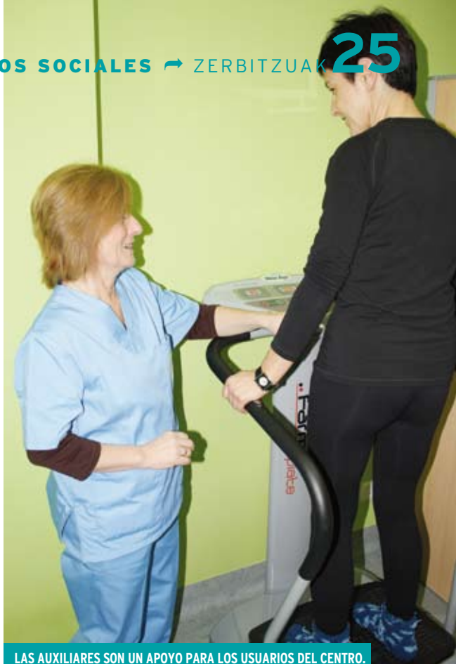
LAS AUXILIARES SON UN APOYO PARA LOS USUARIOS DEL CENTRO.