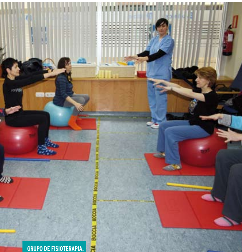
GRUPO DE FISIOTERAPIA.