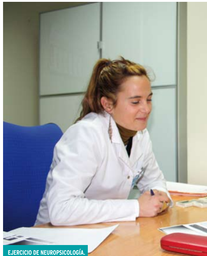
EJERCICIO DE NEUROPSICOLOGÍA.