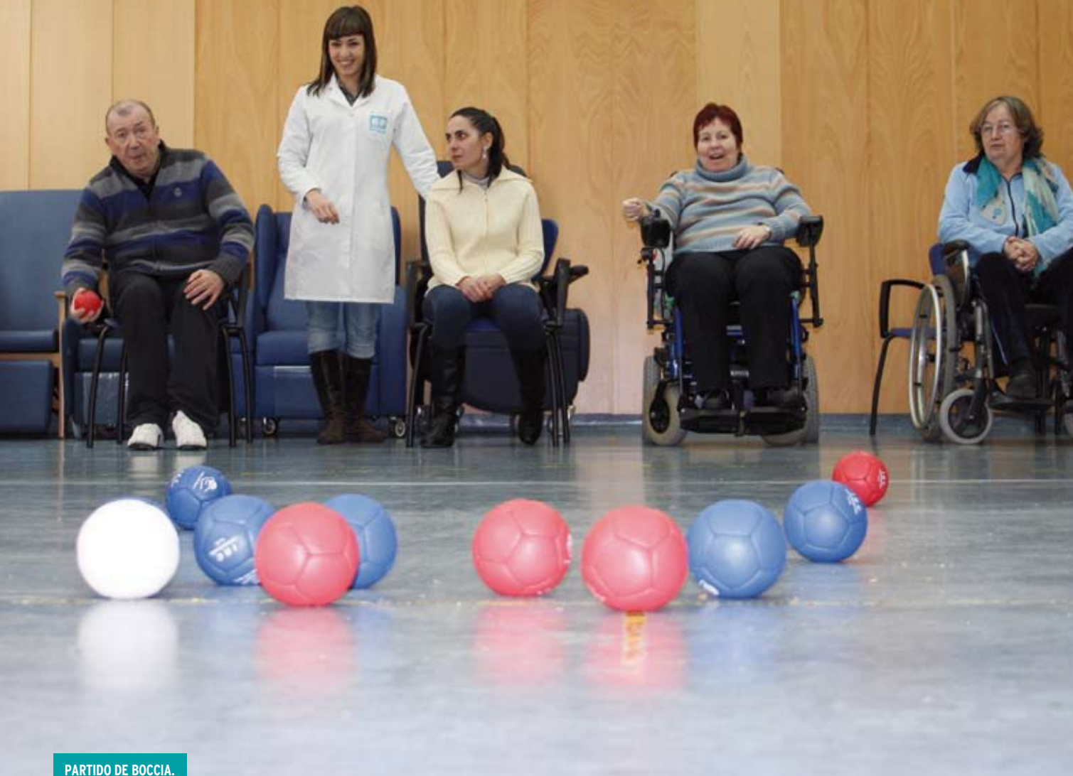
PARTIDO DE BOCCIA.