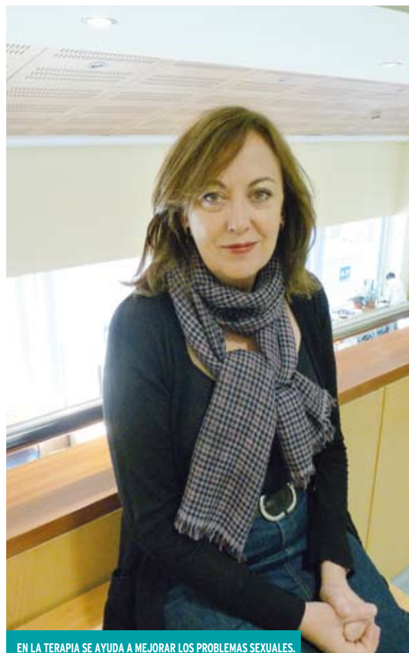
EN LA TERAPIA SE AYUDA A MEJORAR LOS PROBLEMAS SEXUALES.