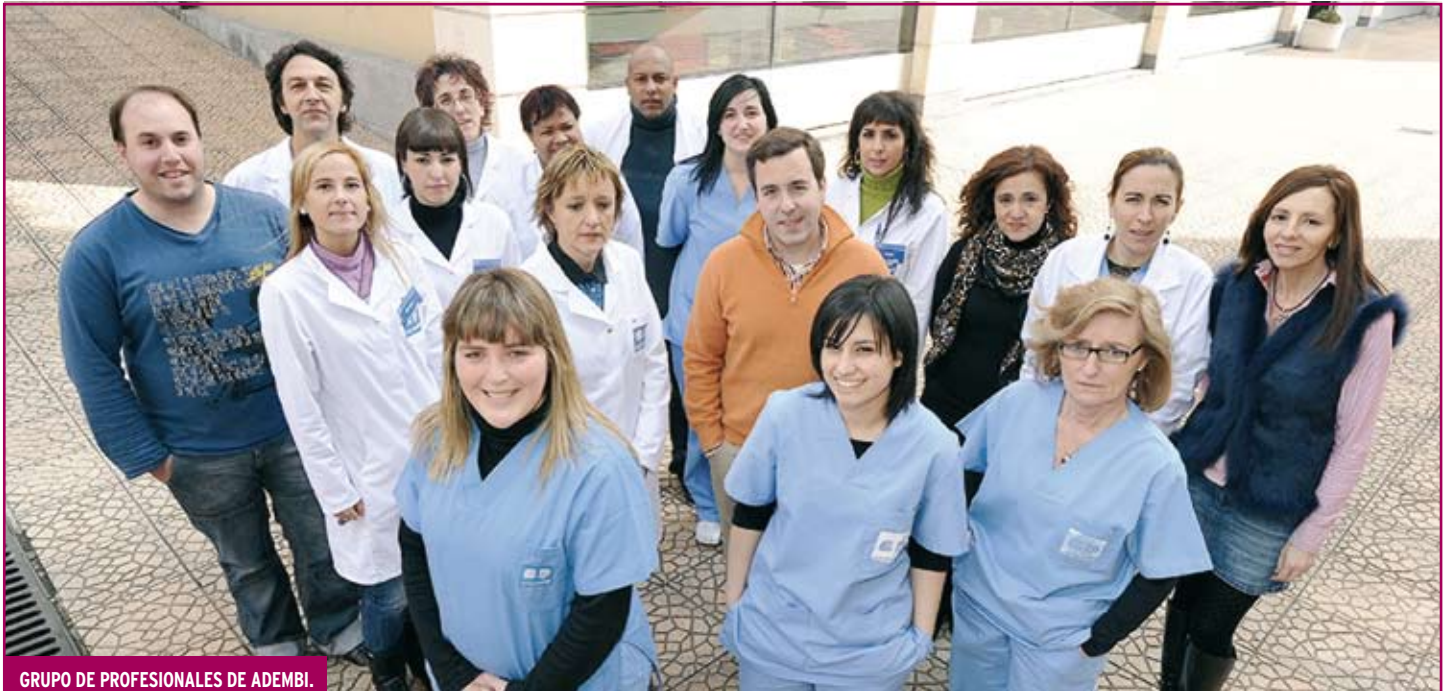
GRUPO DE PROFESIONALES DE ADEMBI.