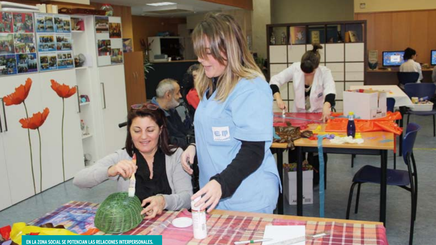
EN LA ZONA SOCIAL SE POTENCIAN LAS RELACIONES INTERPERSONALES.