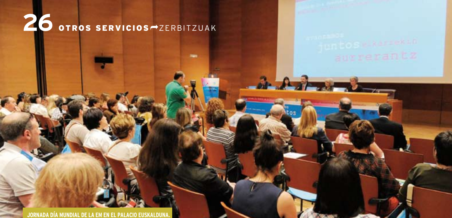
JORNADA DÍA MUNDIAL DE LA EM EN EL PALACIO EUSKALDUNA.