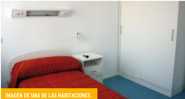
IMAGEN DE UNA DE LAS HABITACIONES.