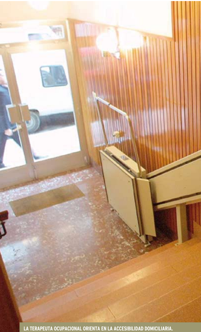
LA TERAPEUTA OCUPACIONAL ORIENTA EN LA ACCESIBILIDAD DOMICILIARIA.