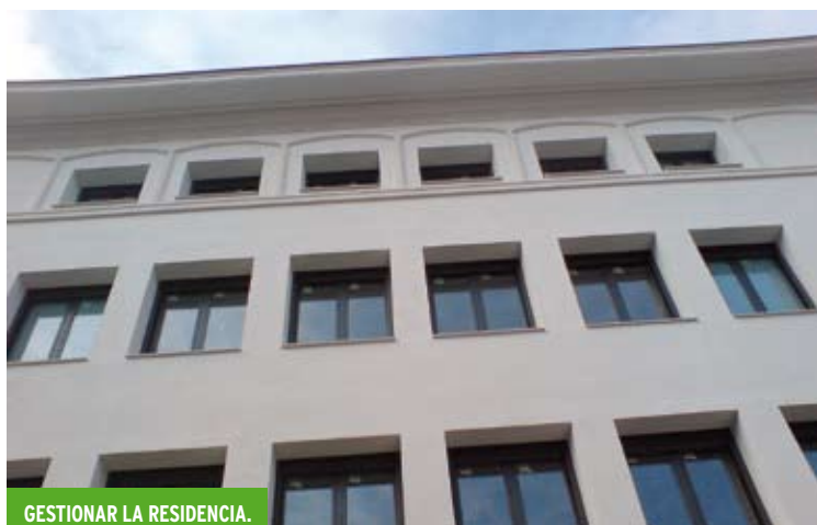
GESTIONAR LA RESIDENCIA.