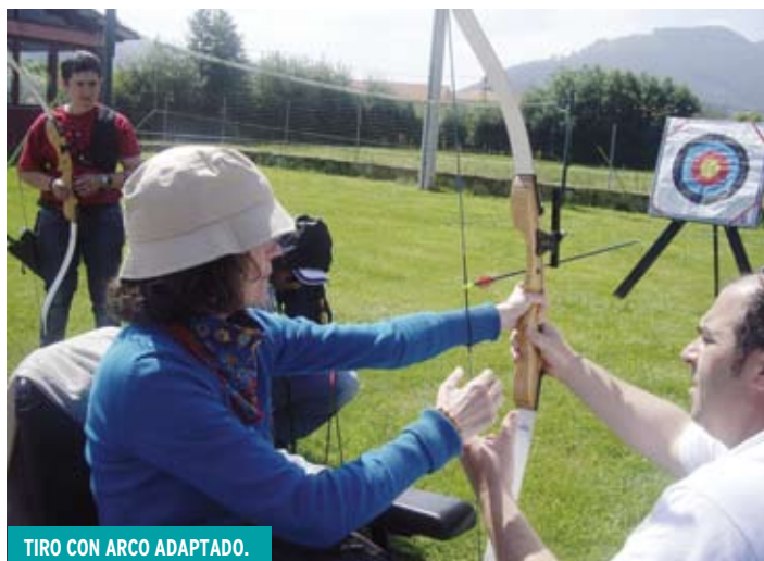
TIRO CON ARCO ADAPTADO.