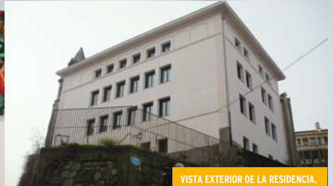
VISTA EXTERIOR DE LA RESIDENCIA.