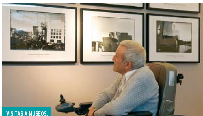
VISITAS A MUSEOS.

Este año se han impartido 12 charlas informativas sobre la EM y el trabajo de la Asociación.