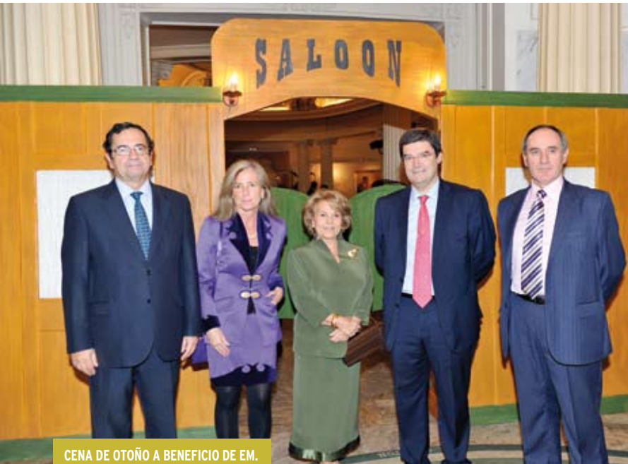
CENA DE OTOÑO A BENEFICIO DE EM.