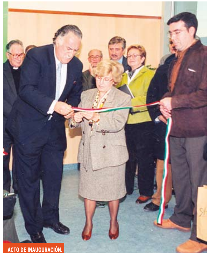
ACTO DE INAUGURACIÓN.

Con la apertura del Centro de Rehabilitación, se inició el cambio, el crecimiento y la etapa más productiva de la Asociación de EM de Bizkaia. A partir de ese momento, ADEMBI ha sido pionera y referencia en muchos aspectos, por la apertura del primer Centro de Rehabilitación en EM de Euskadi; por ser la primera entidad en España en conseguir la ISO: 9001 y por ser el ejemplo de Asociación de EM referente por la calidad de los servicios que ofrece y por su dinamismo en las acciones de comunicación y captación de fondos y en la innovación.