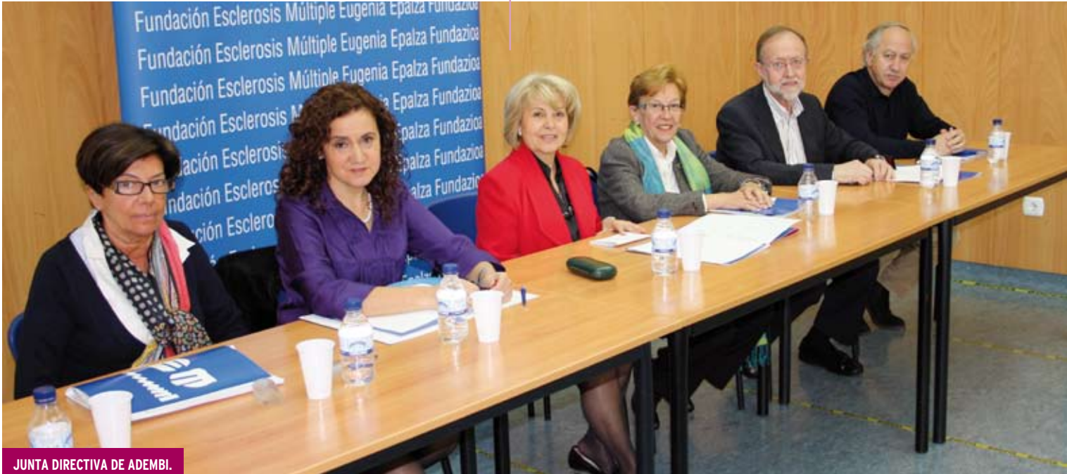
JUNTA DIRECTIVA DE ADEMBI.