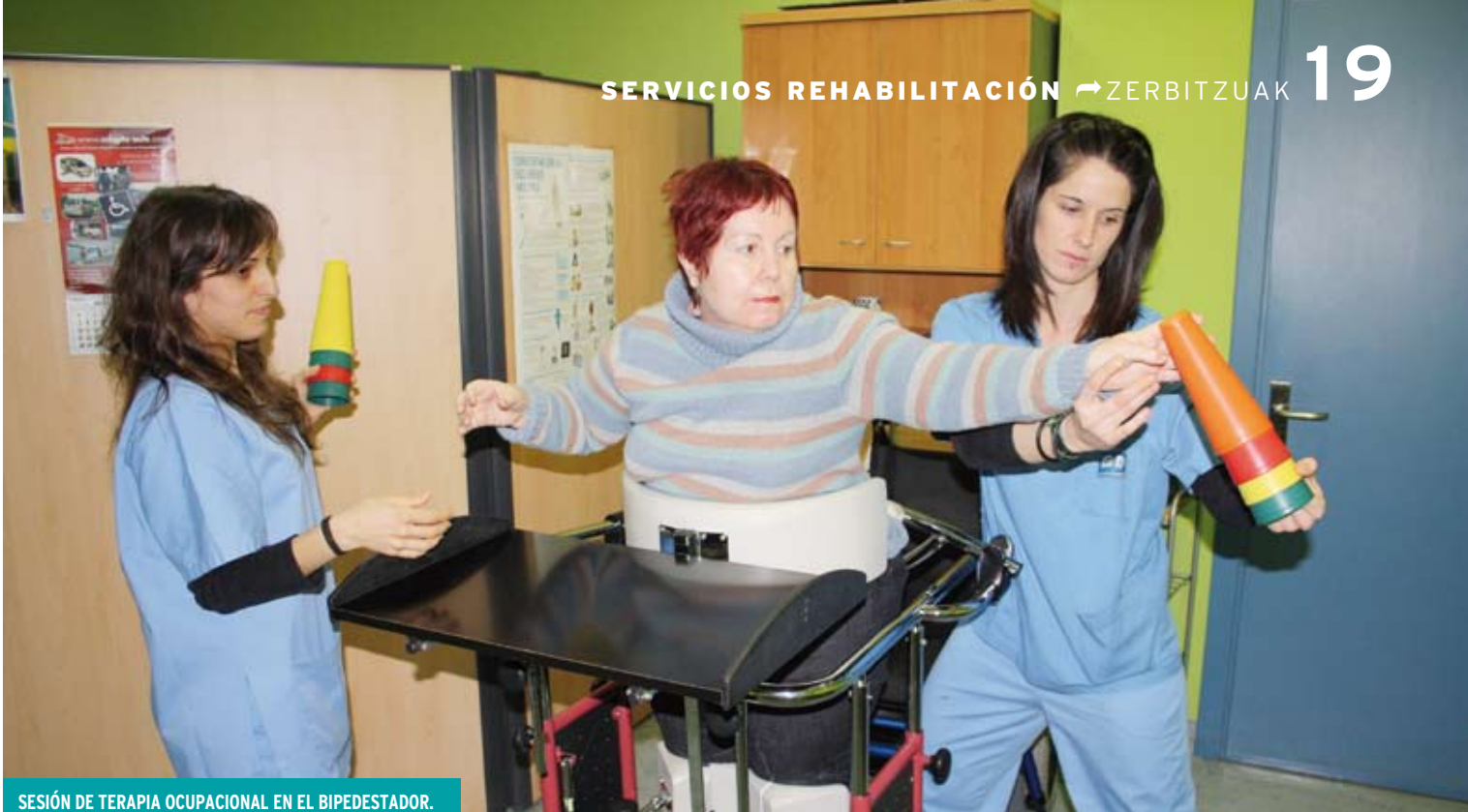
SESIÓN DE TERAPIA OCUPACIONAL EN EL BIPEDESTADOR.