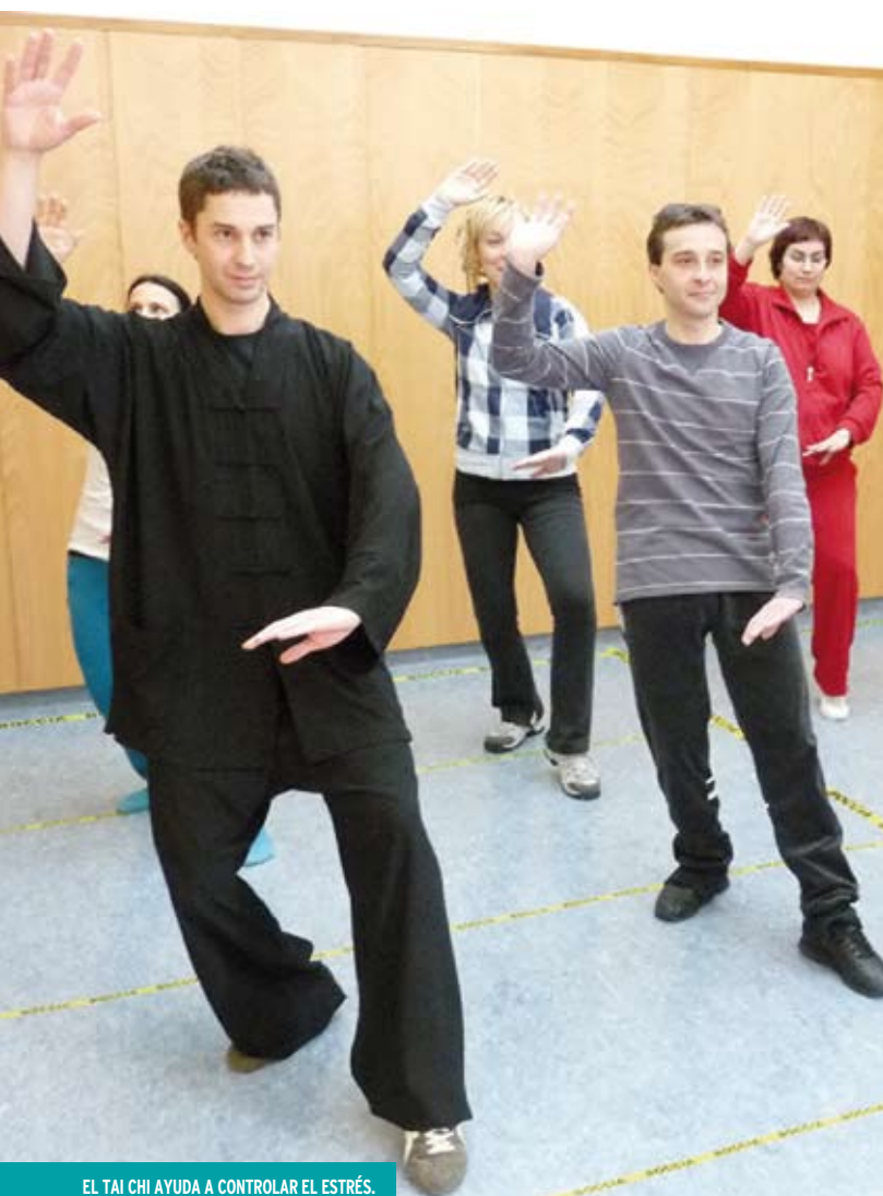
EL TAI CHI AYUDA A CONTROLAR EL ESTRÉS.

En 2010 se han ofrecido 44 sesiones grupales en las que han participado una media de seis usuarios.