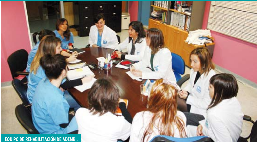
EQUIPO DE REHABILITACIÓN DE ADEMBI.

Los servicios de rehabilitación y sociales que se ofrecen en el Centro de Rehabilitación Eugenia Epalza contribuyen a mejorar la calidad de vida de las personas con Esclerosis Múltiple, ayudándoles a recuperar, según sus necesidades, el máximo nivel de funcionalidad e independencia y a mejorar su condición física, psicológica y social.