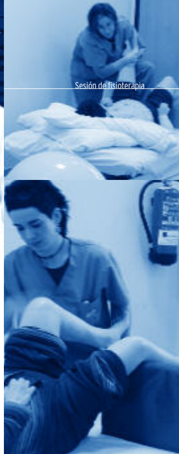
Sesión de fisioterapia