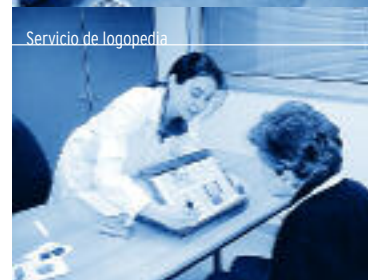
Servicio de logopedia