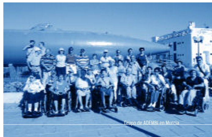
Grupo de ADEMBI en Murcia