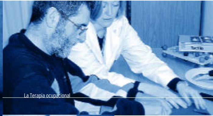
La Terapia ocupacional