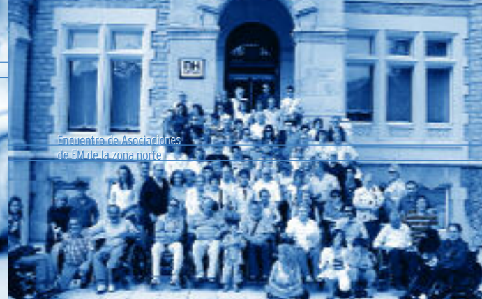
Encuentro de Asociaciones de EM de la zona norte