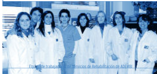
Equipo de trabajadores de Servicios de Rehabilitación de ADEMBI