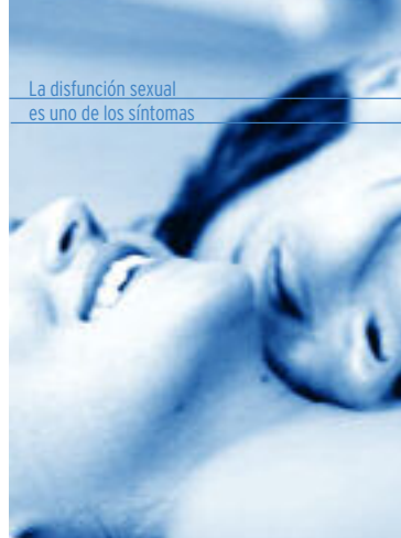
La disfunción sexual es uno de los síntomas

La disfunción sexual es uno de los síntomas de Esclerosis Múltiple. Algunas personas con EM necesitan ayuda para ajustar el impacio de la enfermedad sobre su sexualidad y su relación de pareja.