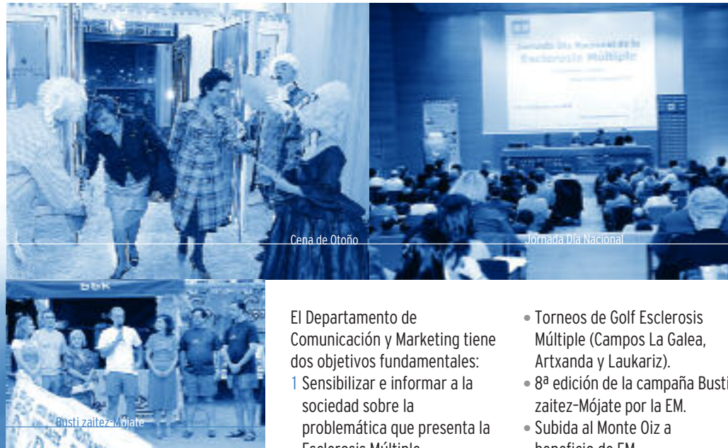
Cena de Otoño

Diagnóstico Interno de Igualdad de Oportunidades: Por último, y con el objetivo de tener en cuenta la igualdad de oportunidades, en ADEMBI, se ha realizado un Estudio/Diagnóstico de la plantilla de ADEMBI en relación a la perspectiva de género e igualdad de oportunidades, gracias a una subvención de Presidencia de la Diputación Foral de Bizkaia. Dicho diagnóstico ha sido elaborado por una empresa externa, especializada en este tipo de estudios, denominada Biker Consulting.