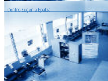
Centro Eugenia Epalza