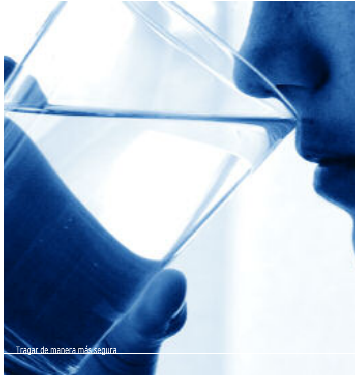
Tragar de manera más segura

directamente en la alimentación y en el habla.